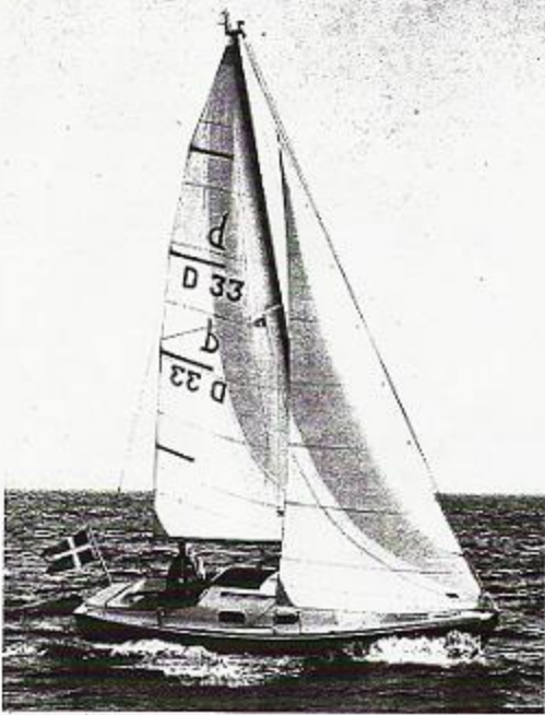
◀ Drabant 22 er en af de både, man vender sig efter, når den kommer forbi. En køn og harmonisk lille fremtoning.